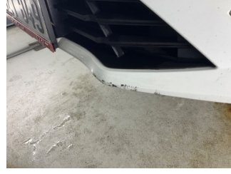
Tampon, ön, Ön tampon > Hasarlı