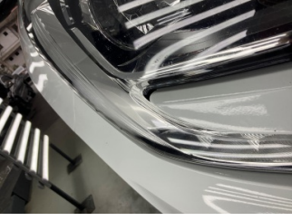
Farlar, Far camı, sağ > Islak-Nemli