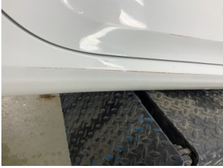
Marşbiyel, sağ, Marşbiyel, sağ > Çizik