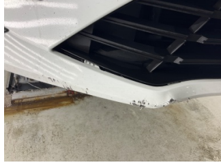
Tampon, ön, Ön tampon > Hasarlı