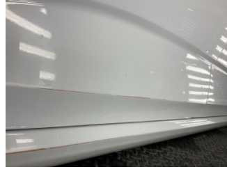
Kapı, sağ arka, Kapı, sağ arka > Çizik