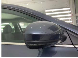
Dikiz aynası, sağ, Dış dikiz aynası > Çizik