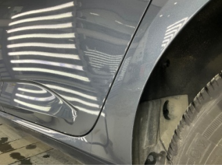
Çamurluk, sol arka, Çamurluk, sol arka > Çizik