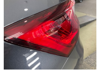
Arka lambalar, Arka lambalar, sol > Islak-Nemli