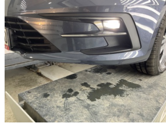
Tampon, ön, Ön tampon > Hasarlı