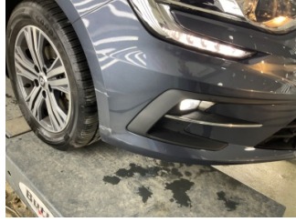
Tampon, ön, Ön tampon > Hasarlı