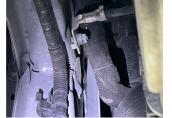
Kaporta, Sol Ön Şase > Hasarlı