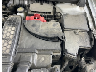
Döşemeler/Kapaklar, Döşemeler/Kapaklar > Hasarlı