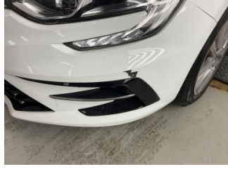
Tampon, ön, Ön tampon > Boyası Atmış