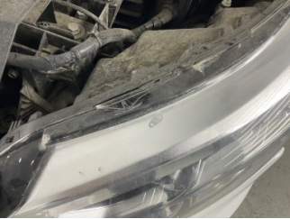
Farlar, Far, sol > Hasarlı