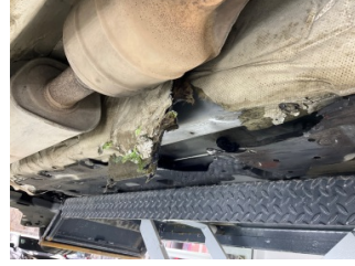
Kaporta, Muhafaza, orta > Hasarlı