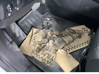
Taban, Paspaslar > Deforme Olmuş

Sayfa: 9/10 Araç Çıkış Tarihi: 15.01.2025 12:42