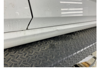
Marşbiyel, sağ, Marşbiyel, sağ > Hasarlı