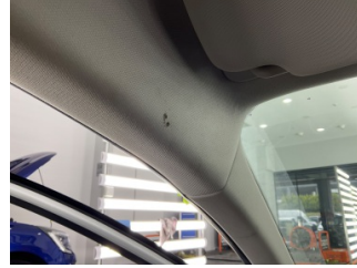
Döşemeler/Kapaklar, Tavan döşemesi > Yakıcı Madde Ile Zarar Görmüş