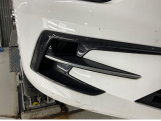
Sis lambaları, Sis farı, sağ > Sökülmüş-Yok