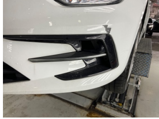
Sis lambaları, Sis farı, sol > Sökülmüş-Yok