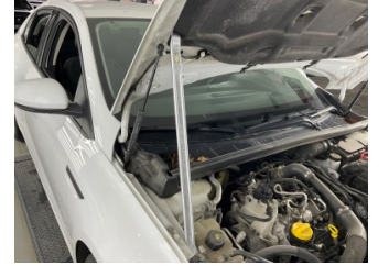
Motor kaputu, Dayama çubuğu/Amortisör > Hasarlı