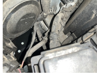
Kaporta, Sol Ön Şase > Hasarlı