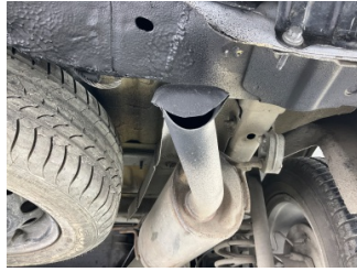
Egzoz sistemi, Arka boru > Hasarlı