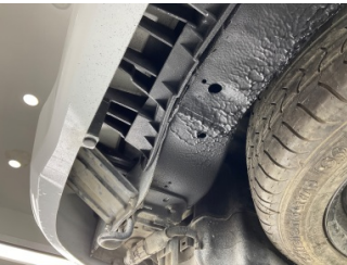
Arka bölüm, Arka sac/panel > Hasarlı