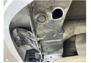
Arka bölüm, Arka sac/panel > Hasarlı