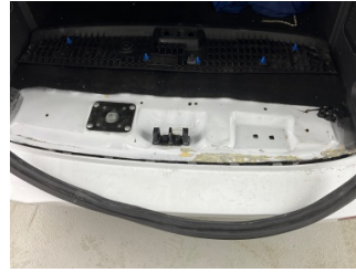
Arka bölüm, Arka sac/panel > Hasarlı