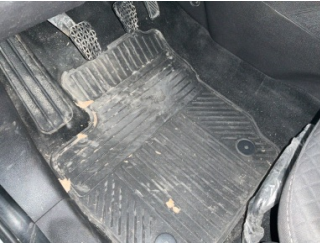
Taban, Paspaslar > Deforme Olmuş