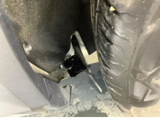
Çamurluk, sol arka, Davlumbaz > Hasarlı