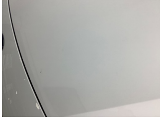
Motor kaputu, Motor kaputu > Taş izi