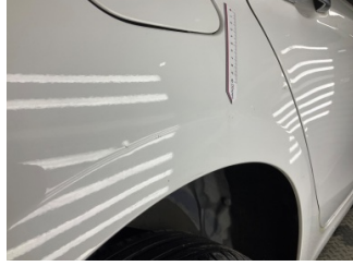
Çamurluk, sağ arka, Çamurluk, sağ arka > Ezik