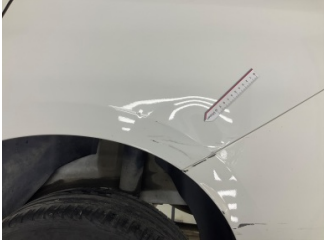
Çamurluk, sol arka, Çamurluk, sol arka > Hasarlı