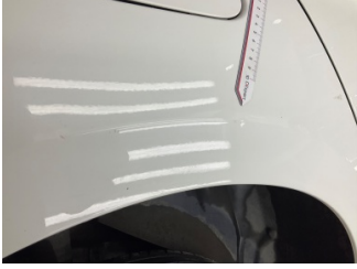
Çamurluk, sağ arka, Çamurluk, sağ arka > Ezik