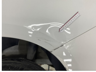
Çamurluk, sol arka, Çamurluk, sol arka > Hasarlı