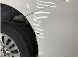
Tampon, arka, Arka tampon > Çizik