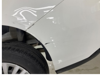
Tampon, arka, Arka tampon > Çizik