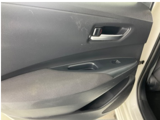
Döşemeler/Kapaklar, Kapı döşemesi, sol arka > Çizik