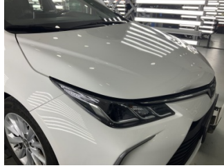
Motor kaputu, Motor kaputu > Sabitlemesi Hatalı