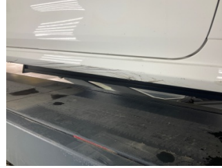
Marşbiyel, sağ, Marşbiyel plastiği, sağ > Çizik