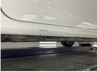
Marşbiyel, sol, Marşbiyel plastiği, sol > Çizik