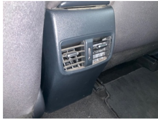
Kalorifer/Klima, Havalandırma ızgarası > Hasarlı