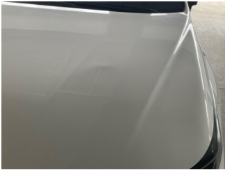
Motor kaputu, Motor kaputu > Hasarlı