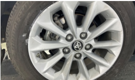
Jant, sağ arka > Çizik