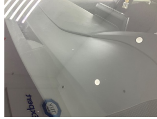
Camlar, Ön cam > Taş izi