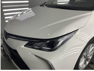
Motor kaputu, Motor kaputu > Sabitlemesi Hatalı