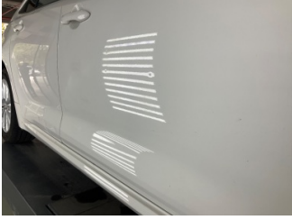
Kapı, sağ ön, Kapı, sağ ön > Ezik