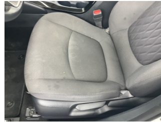
Koltuklar, ön, Koltuk döşemesi, sol ön > Yakıcı Madde ile Zarar Görmüş