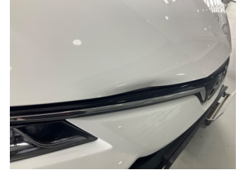
Motor kaputu, Motor kaputu > Hasarlı