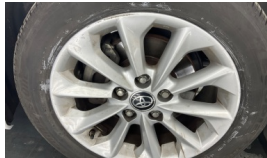
Jant, sol ön > Çizik