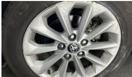
Jant, sol arka > Çizik