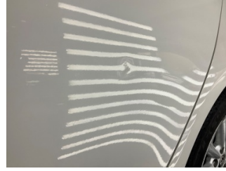
Kapı, sol arka, Kapı, sol arka > Ezik