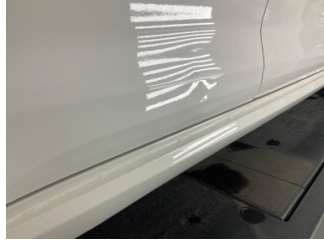
Kapı, sağ arka, Kapı, sağ arka > Ezik