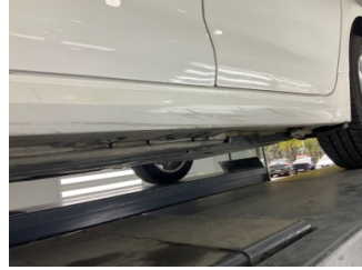
Marşbiyel, sol, Marşbiyel plastiği, sol > Çizik