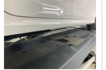
Marşbiyel, sağ, Marşbiyel plastiği, sağ > Çizik