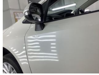
Kapı, sol ön, Kapı, sol ön > Ezik