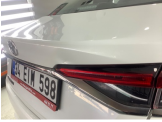
Bagaj kapağı/kapısı, Bagaj kapısı > Ezik