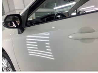
Kapı, sol ön, Kapı, sol ön > Ezik