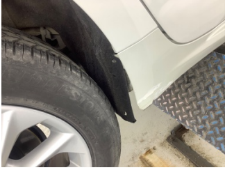
Çamurluk, sağ arka, Davlumbaz > Hasarlı