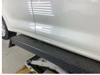
Marşbiyel, sağ, Marşbiyel plastiği, sağ > Hasarlı