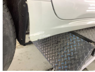
Marşbiyel, sağ, Marşbiyel plastiği, sağ > Hasarlı